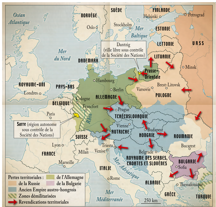
Un autre monde Des décombres des Empires allemand (amputé), austro-hongrois (démantelé) et russe (raboté) émergent des nations (Finlande, pays Baltes, Tchécoslovaquie, royaume des Slaves, Croates et Slovènes). Mais des revendications territoriales menacent ce découpage. • Sources : Atlas des guerres (Autrement), 1914-1918 raconté par Michel Winock (Perrin).