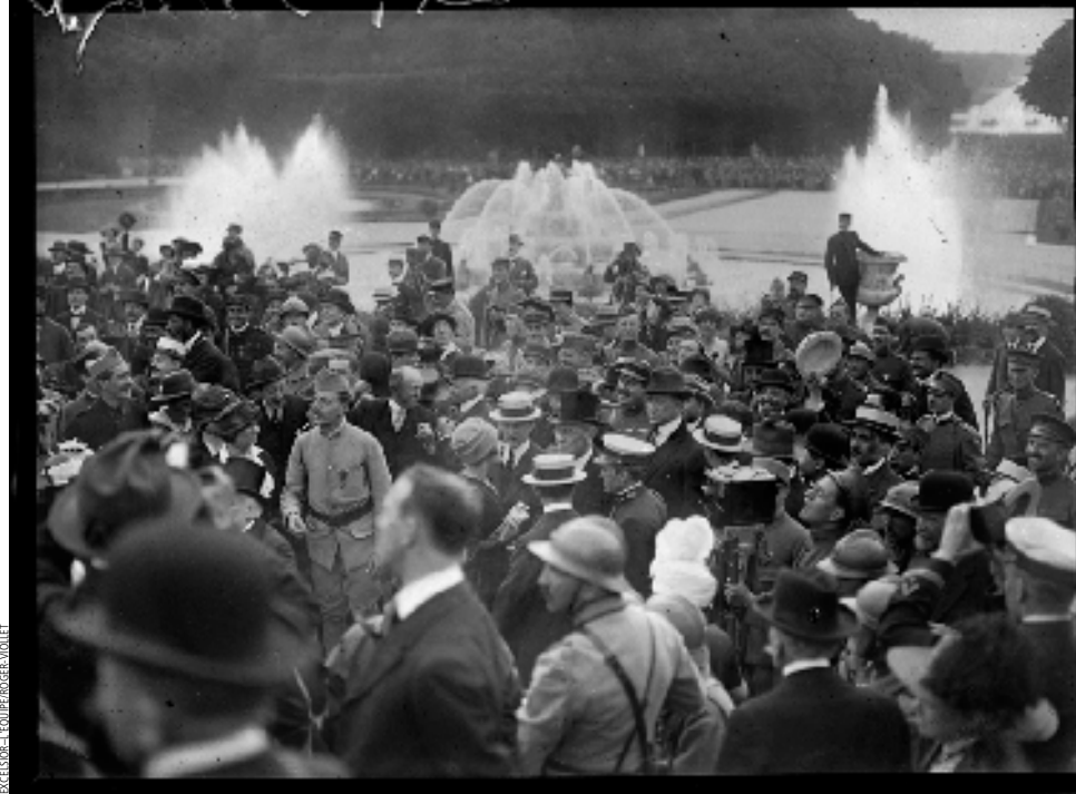
Solennité La foule se masse devant l'entrée de la galerie des Glaces, guettant l'épilogue de cette séance historique. La liesse n'est qu'apparente, car des critiques s'élèvent dans les deux camps contre cette « paix au comptant », comme l'ont qualifiée ses détracteurs britanniques.