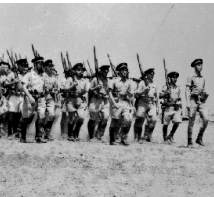
MUSÉE DE L'ORNE DE LA LIBÉRATION

Vers 11 h20, le colonel Dawson, le patron du Commando n° 4, donne l'ordre de se rassembler au sud de la ville, c'est-à-dire dans les ruines de l'ancienne colonie de vacances. Les hommes refont le chemin dans l'autre sens, croisant les Britanniques débarqués avec les deuxième et troisième vagues d'assaut. Vingt-cinq minutes de repos sont octroyées par Kieffer. Peu avant 13 heures, toujours sur l'ordre de Dawson, l'ensemble du Commando franco-britannique n° 4 se remet en marche, les Anglais en avant-garde, les Français fermant la marche cette fois-ci. Les pertes des Français ce matin-là s'élèvent à 66 hommes, dont 10 tués. La première partie de la mission a été accomplie. Il leur faut désormais faire la jonction avec les troupes parachutistes britanniques à Bénouville, avant de s'installer sur les hauteurs d'Amfreville en fin de journée pour tenir le verrou de l'Orne. ♦