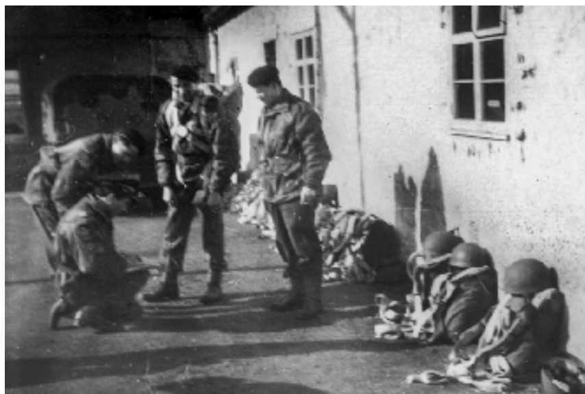
MUSÉE DE LA RÉSISTANCE BRETONNE DE SAINT-MARCEL