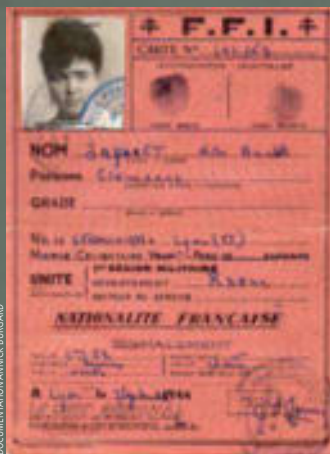
DOCUMENTATION ANNICK BURGARD